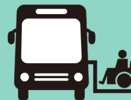
ノンステップバス